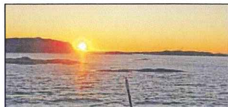
Det aktuella området för en bro eller vägbank.