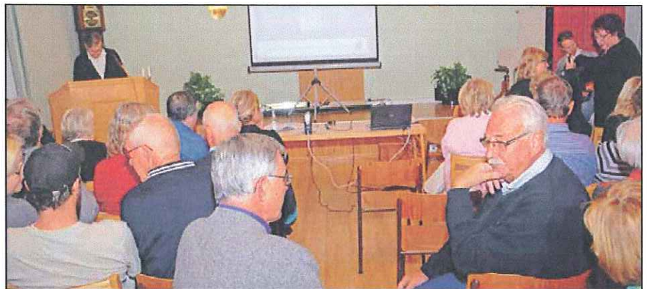
100 kommuninvånare kom till informationskvällen i Rörö församlingshem.

Stora värden på spel Områden som berörs är dels Hyppelns norra och östra delar, ner och förbi hamnen. Vad gäller Rörö så är södra delen samt halva